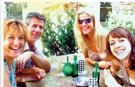
Jenneviev: "Dit gezin was een vier-eenheid, de liefde straalde er vanaf"